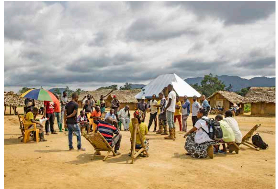
Hälsoinformation bland invånarna i distriktet Salamabila i Kongo-Kinshasa. Malaria hör till de främsta dödsorsakerna här och genom att öka människors medvetenhet om symptom och behandling kan många liv räddas.

Läkare Utan Gränser har stöttat regionsjukhuset i Baidoa sedan 2017, bland annat med akut förlossningsvård, neonatal vård och behandling av undernäring. Ändå