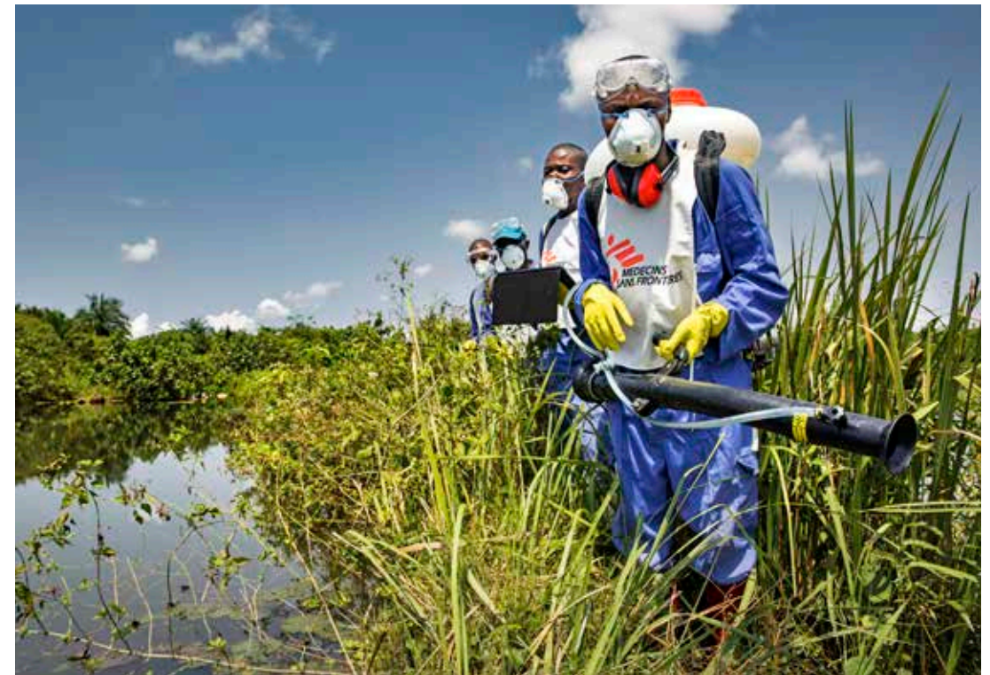
På Läkare Utan Gränser kliniker i Kongo-Kinshasa är malaria en av de allra vanligaste diagnoserna. Vi gör även förebyggande insatser, till exempel genom att spraya insektsdödande medel i stillastående vatten.

flest liv av alla: tuberkulos, hiv och malaria. Det här är sjukdomar som går att förebygga och behandla, så länge det finns resurser. Men i flera kontexter där Läkare Utan Gränser arbetar vittnar personalen redan om att det råder brist på läkemedel, att förebyggande insatser saknar finansiering, om försenad eller bristande hantering av malarieutbrott liksom om dödsfall kopplade till de tre sjukdomarna.