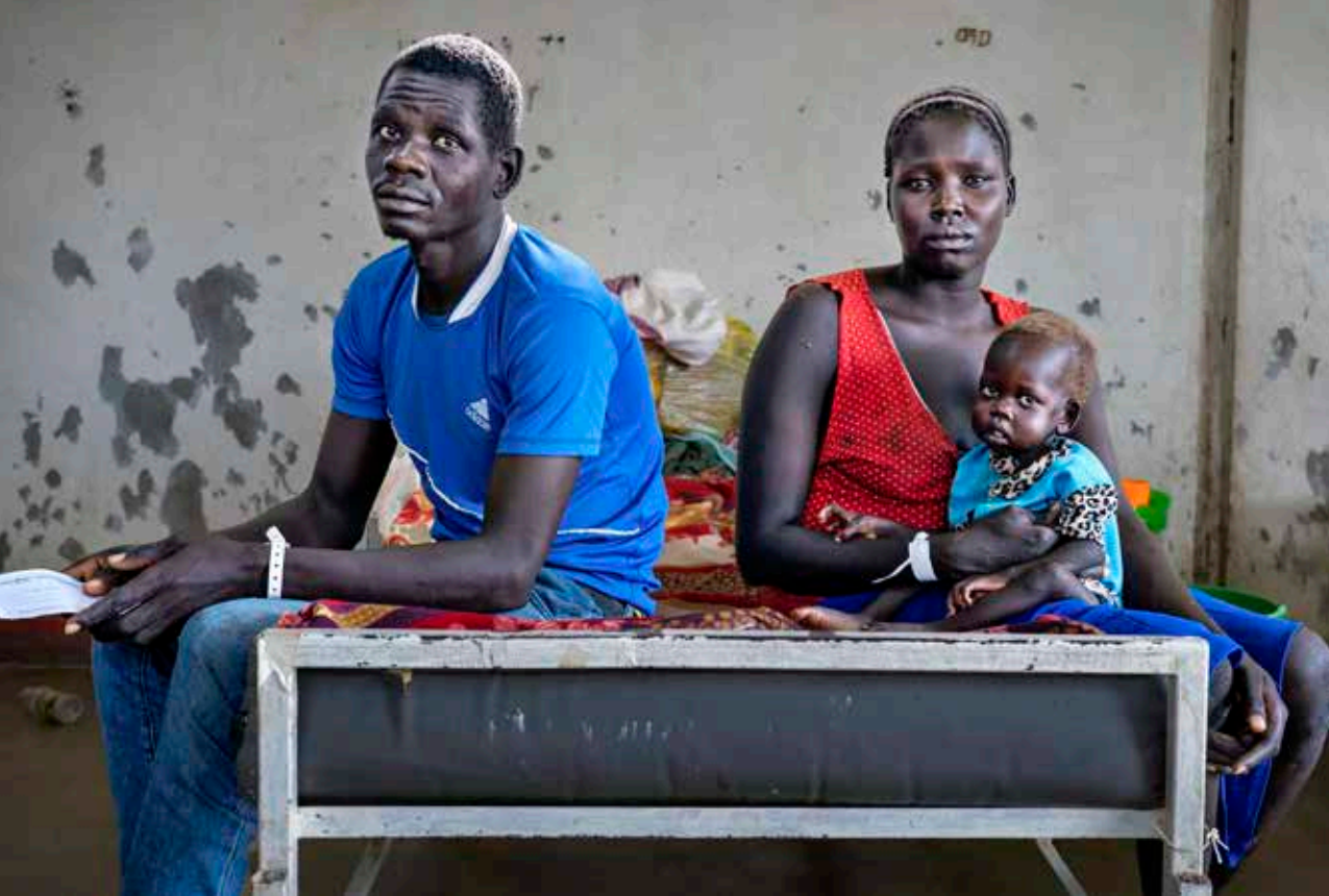
När vårdcentraler i Etiopien tvingas stänga blir det ännu längre att gå för människor i behov av vård. De här föräldrarna har tagit sig till Läkare Utan Gränser kliniker i Kulelägret i Gambella med sin undernärda dotter.

kanska organisationen PEPFAR avslutade sitt arbete med att förebygga, behandla och bedriva forskning kring hiv och aids.