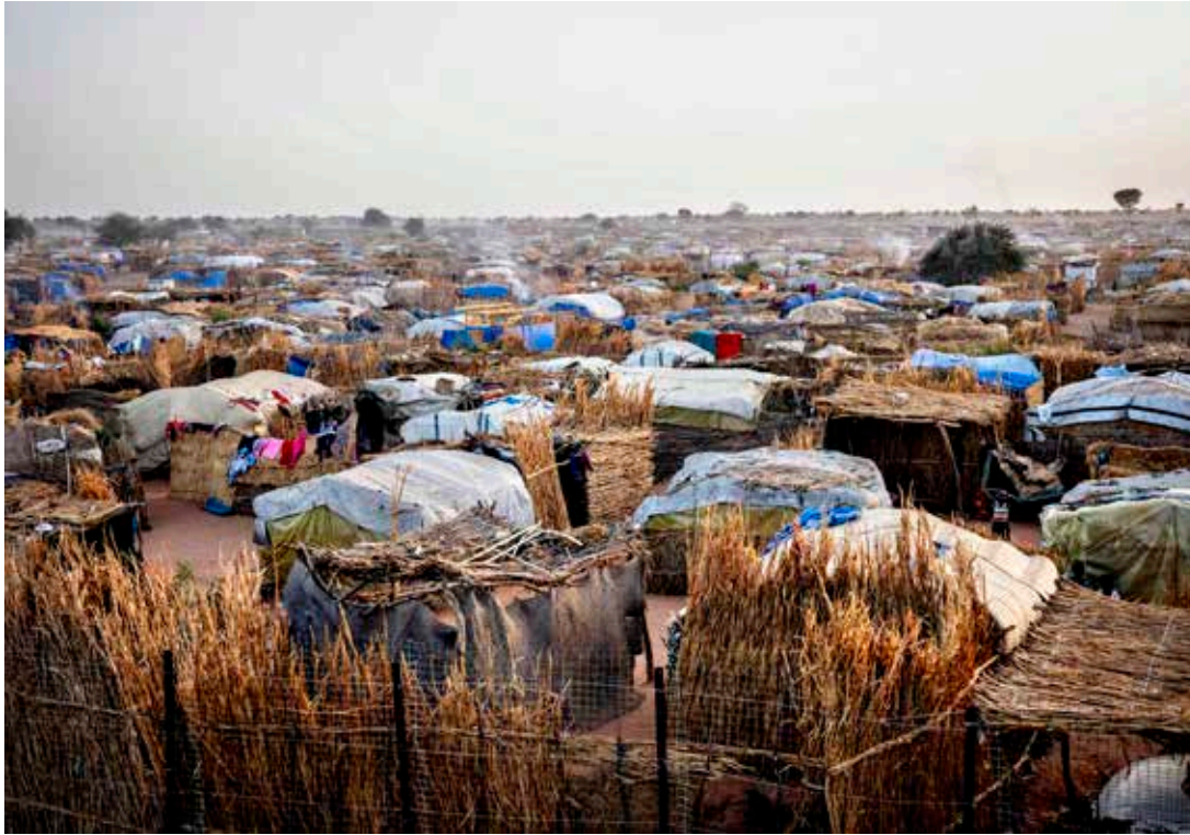
I flyktinglägren i Tchad har det minskade stödet från många stora givare bland annat lett till dramatiskt sämre tillgång till rent vatten. Läkare Utan Gränser påverkas indirekt när behovet av våra insatser ökar.