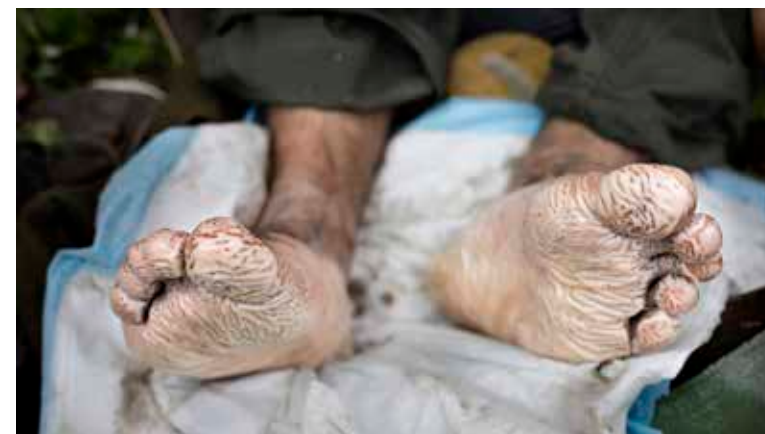
Så kallad skyttegravsfot hör till de vanligaste åkommorna i skogen.

koll på lagar och regler, för att veta vad vi har rätt att göra och inte.