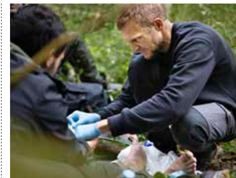
En sjukvårdare från Läkare Utan Gränser behandlar en skadad fot.

Enligt statistikbanken We are monitoring , där data samlas in från en larmtelefon och från hjälparbetarna på plats i skogen, har det i skrivande stund registrerats 23 403 personer på flykt. De flesta kommer från Irak, Libanon och Syrien, samt från Eritrea, Etiopien och Sudan. De låga temperaturerna på vintern överraskar många flyktingar och behoven av vård ökar ofta under den kalla årstiden. Men på grund av byrå-