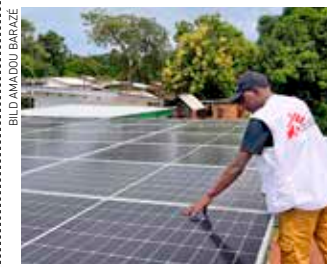
Solpaneler på sjukhuset i Batangafo.

I Centralafrikanska republiken slår elbristen hårt mot sjukvården. Därför har Läkare Utan Gränser installerat solcellssystem som driver operations-salar, laboratorier och håller vacciner kyllda. Det har minskat användningen av diesel med tiotusentals