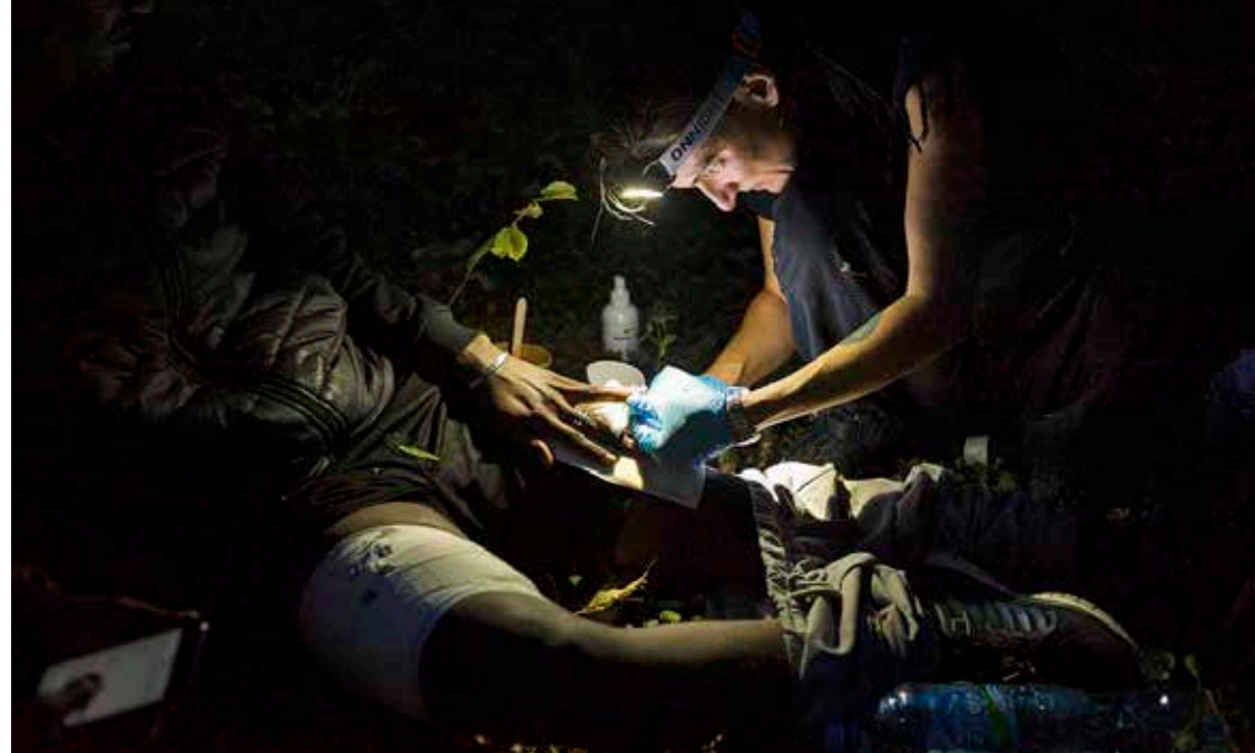
En skadad man får hjälp med sitt ben.

– Hittills har det inte alls lyckats och vi är mycket noga med att ha