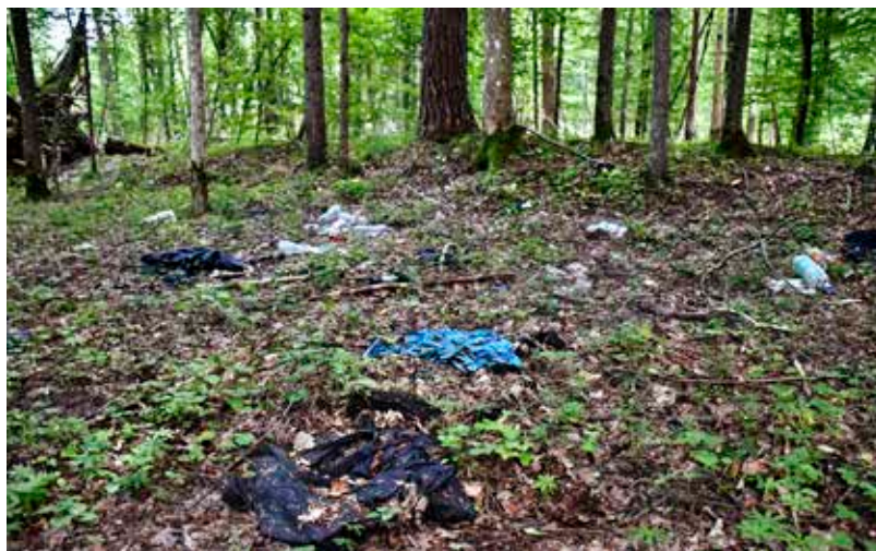
ÖVRE BILD: Gränsen mellan Polen och Belarus. NEDRE BILD: Kläder och andra prylar visar spår efter människor i skogen.