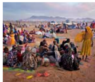
På flykt mot Tchad.

intyg och sa »Du vill hjälpa Sudans armé, du vill ta hand om fienden!« Sen brände de intyget och släpade iväg mig. Jag var med några andra kvinnor i bilen, bland dem min syster som de beordrade ner på golvet i bilen. De våldtog bara mig – på grund av intyget. Min familj sa åt mig att inte berätta för någon så jag har inte sökt vård förrän